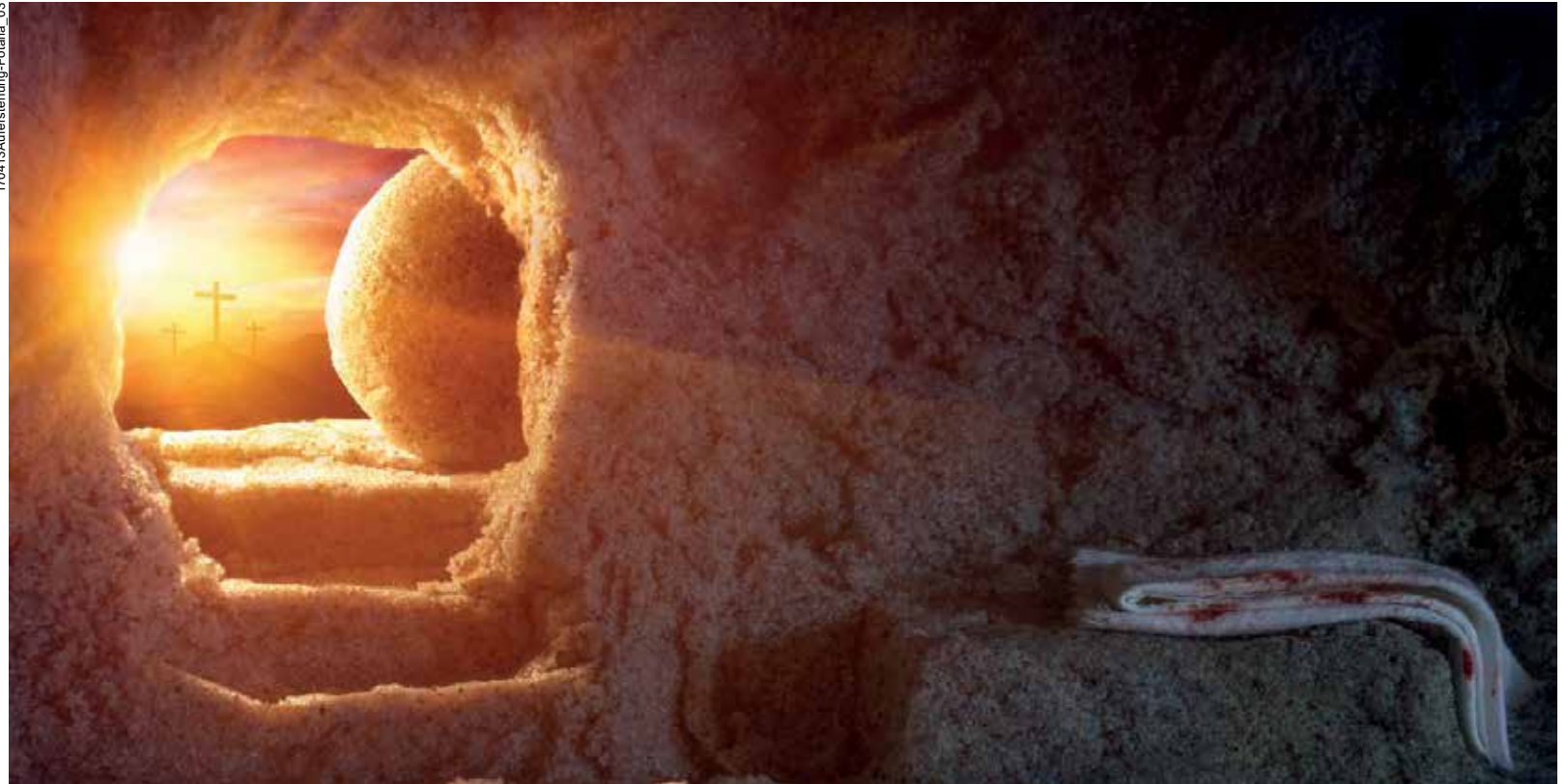
Blick aus dem leeren Grab auf das ebenfalls leere Kreuz