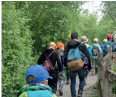
Unterwegs mit Hanania

Ob gemeinsam auf der Suche nach den Tieren von Noahs Arche oder auf einer Reise in längst vergangene Zeiten; die Erlebnistage waren jedes Jahr ein Highlight unserer Angebote für Kinder. In den letzten Jahren haben wir während den Frühlingsferien stets grossartige Abenteuer zusammen erlebt, gebastelt, gesungen, gespielt und Geschichten aus der Bibel hautnah miterlebt.